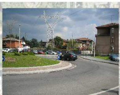
Intersezione Bollate - Stelvio