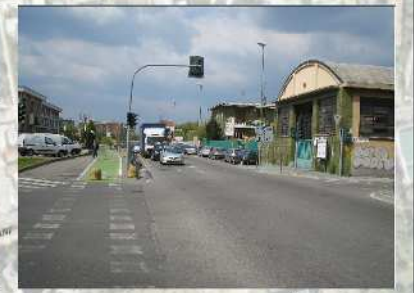
Intersezione Bovisasca - IV Novembre