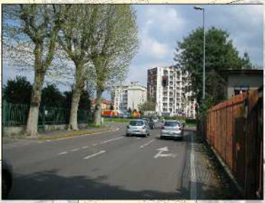
Intersezione Di Vittorio - Gramsci - Baranzate