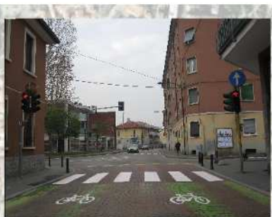
Intersezione Bollate - Vittorio Veneto