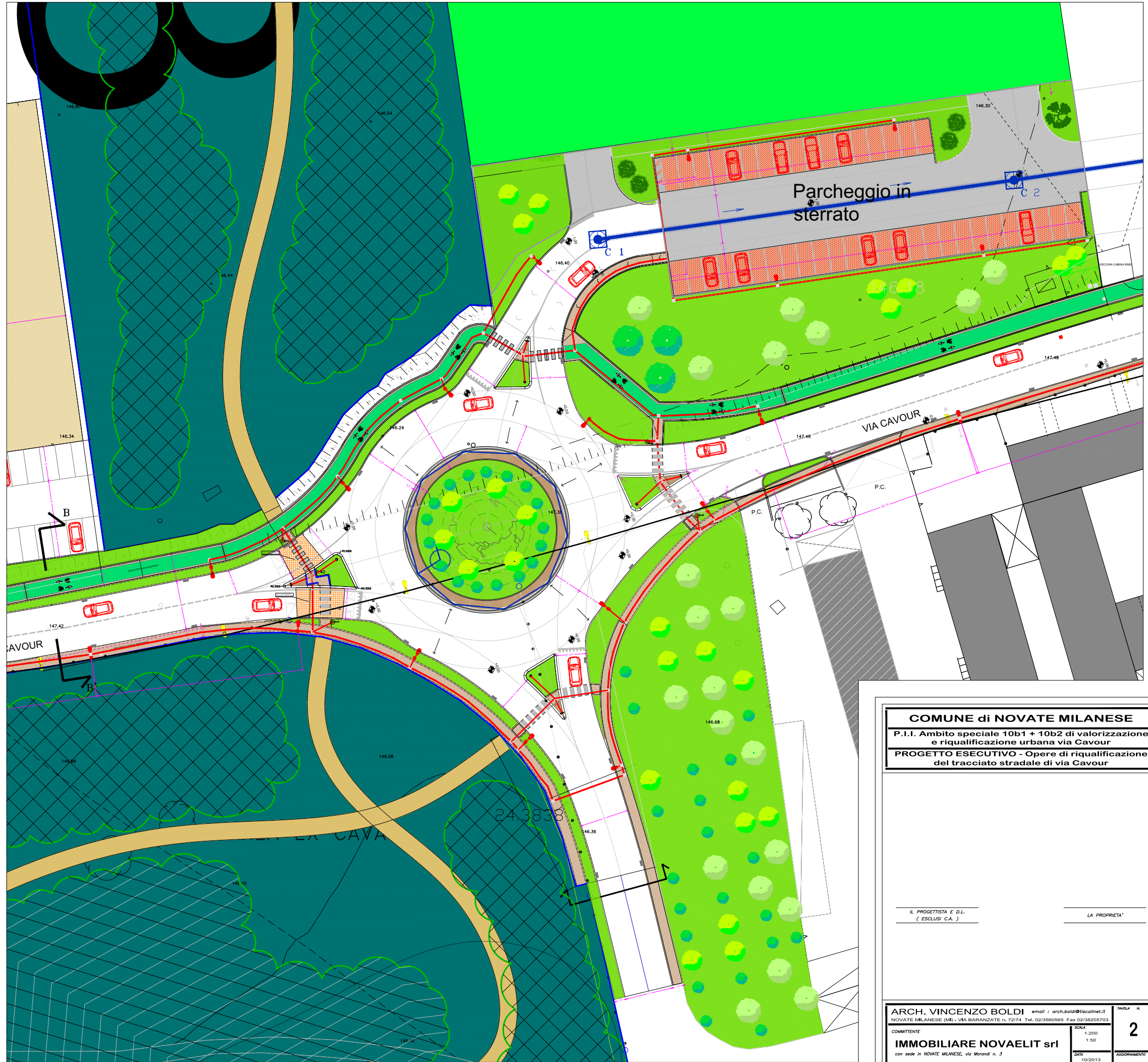
PLANIMETRIA DI PROGETTO SCALA 1/200

COMUNE di NOVATE MILANESE P.I.I. Ambito speciale 10b1 + 10b2 di valorizzazione e riqualificazione urbana via Cavour PROGETTO ESECUTIVO - Opere di riqualificazione del tracciato stradale di via Cavour