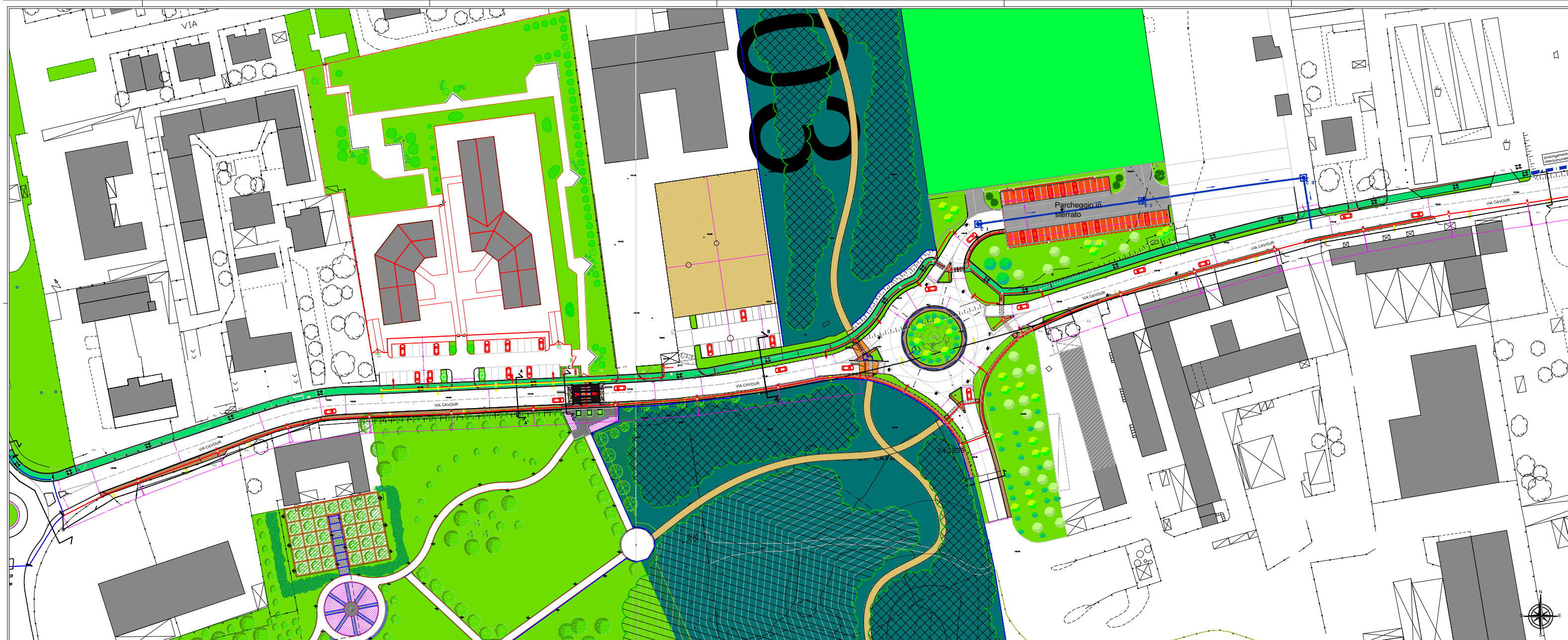
PLANIMETRIA DI PROGETTO SCALA 1/500